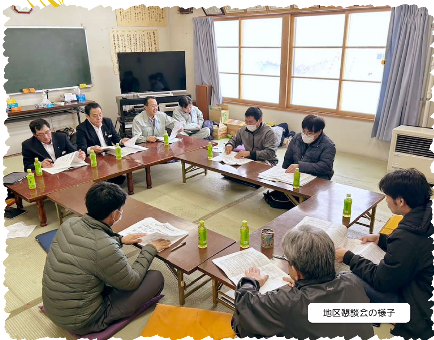
地区懇談会の様子