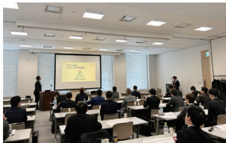
ポリシーブックに関する講習

リーダーとしての資質の向上や円滑な組織運営の手法を取得することを目的とした講演や、JA道青協役員や他単組との意見交換会が行われ、多くの盟友と交流することができました。