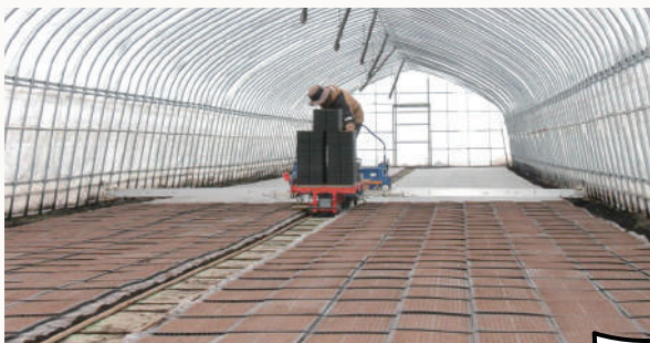
整然と並べられたトレー

今後もハウスの管理など気を抜けない日々が続きますが、外はまだまだ寒さも厳しくハウス内との寒暖差も激しいことから、生産者の皆様におかれましては体調管理には十分気をつけてこれからの作業にあたってください。