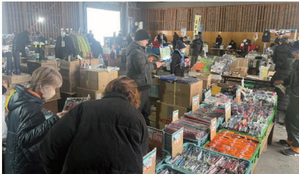
たくさんのご購入ありがとうございます！

来場者は2日間で合計338名となりました。各メーカー協力のもと、数多くのお客様にご来場いただき、盛大な展示即売会となりました。