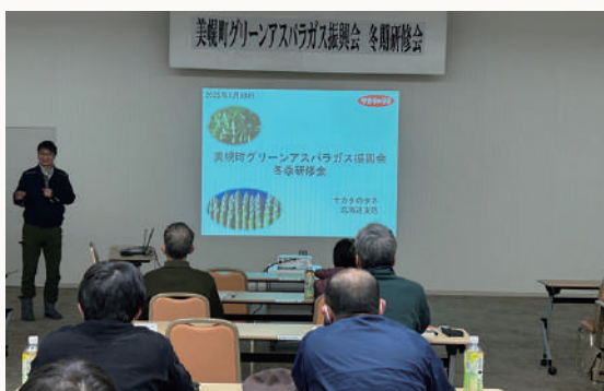
サカタのタネによる研修の様子

出席者は熱心に耳を傾けるだけでなく、研修後の質疑応答では活発に質問もされており、実りのある研修会となりました。