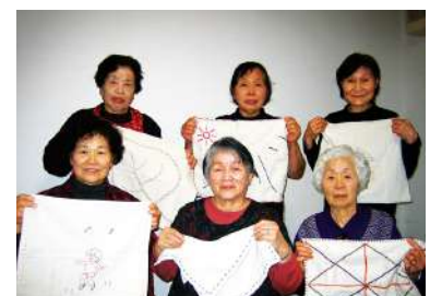
細かい作業に苦戦しました

すみれ会は1月15日～17日の2泊3日、塩別つつる温泉で冬期研修会を開催し6名の部会員が参加しました。令和7年度の事業計画について話し合い、講習会や研修会の内容を検討した後、「ランチョンマット、ふきんの刺し子」作りを行いました。みんなで和気あいあいと楽しいお話をしながら作った作品は生活工夫展に出展する予定です。美味しい食事や温泉で疲れを癒し、仲間たちと楽しく過ごして部員間の親睦をさらに深めることが出来る有意義な研修となりました。