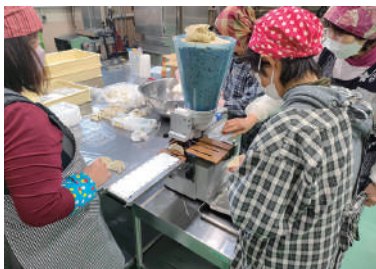
今晚の食卓に並べなきゃ☆