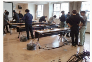
和気あいあいともくし作り