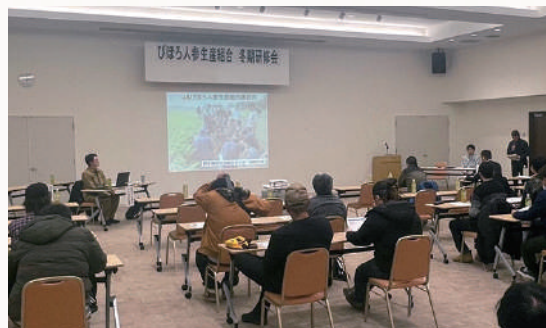
普及所による研修の様子

出席者は熱心に耳を傾けるだけでなく、研修後の質疑応答では活発に質問もされており、大変有意義な研修会となりました。