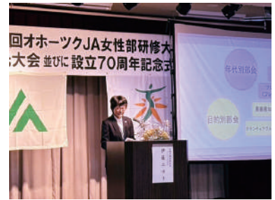
落ち着いた口調で丁寧に発表される伊藤副部長