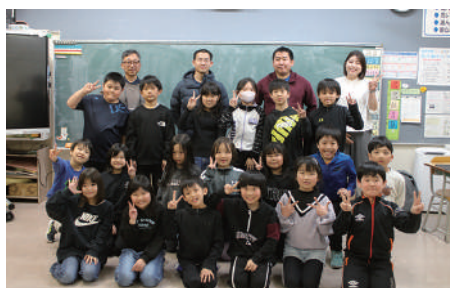
1年間楽しかったね

昨年5月に開校した青年部の食育事業も、無事に全日程を終えることができました。関係者の皆様のご協力に感謝いたします。