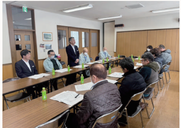
貴重なご意見ありがとうございました！

いただいたご意見・ご要望は、今後のJA事業に反映できるよう各部署および理事会で協議し、適切に対応していくとともに、4月上旬にJAコネクにて回答させていただきます。