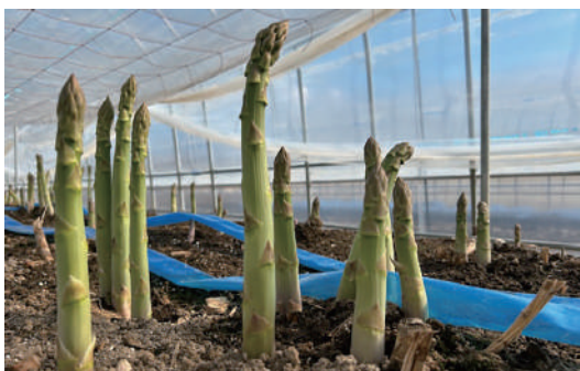
元気なアスパラガス