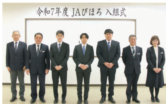
新入職員（3名）と常勤役員

3月21日、令和7年度新入職員入組式が行われました。 今年度は新たに3名の職員が入組しました。皆様どうぞ よろしくお願い致します！