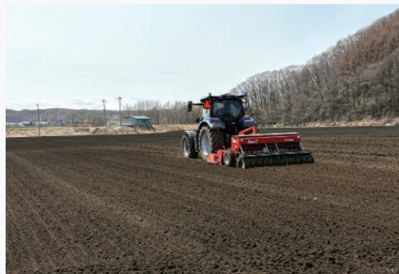
春まき小麦播種作業の様子4月22日撮影

「春よ恋」はタンパク質の含有率が高く、モチモチとした食感の為、主にパンや麺、ピザ用の小麦として使用されています。