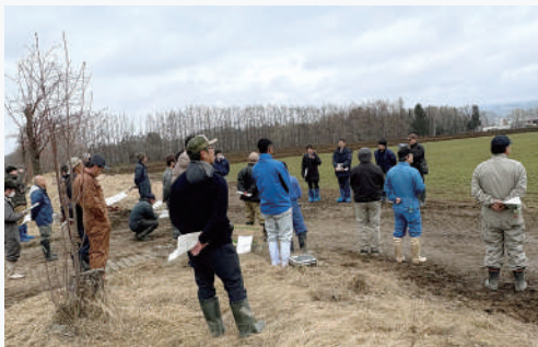
生産者からは、今年の生育状況による栽培管理への質問などが出されました