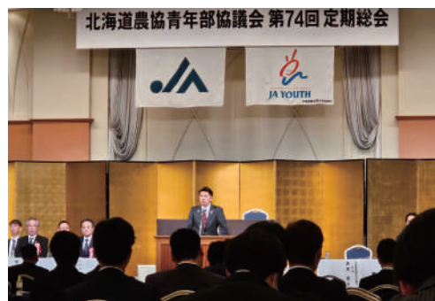
会場は熱気に包まれていました