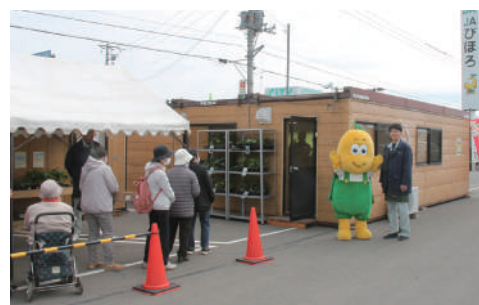
たくさんのご来店お待ちしております

営業日 毎週 火曜日・木曜日・土曜日 ※8月は毎週 火・水・木・金・土 営業時間/AM9:00～PM4:00