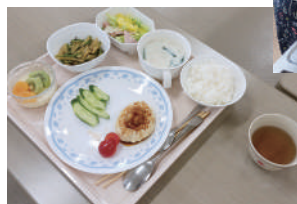
ヘルスリーダーさんに教えてもらいながら調理中

お腹が満たされた後は、JAびほろにて茶話会を開催し、今年度の事業計画に基づき、開催行事について協議しました。本年は11月に軽スポーツ講習会、翌年1月には宿泊を伴った冬期研修会を開催する予定です。活発な話し合いで部員同士の親睦をさらに深めることが出来ました。