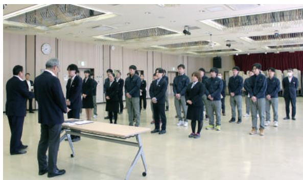
組合長から辞令が交付されました