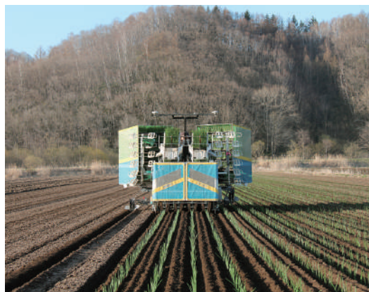
玉葱植付け作業の様子

降雨や降雪が続き作業が遅れたことから、畑や苗の状態を確認しながらの定植作業となりました。