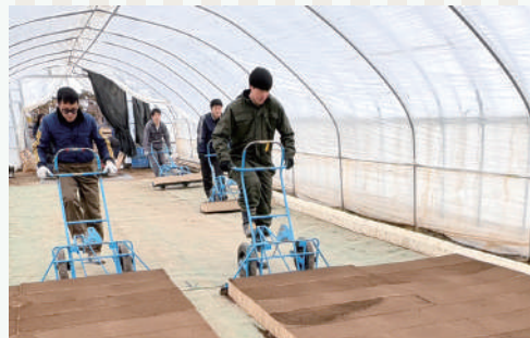
一冊ずつ丁寧に設置していきます