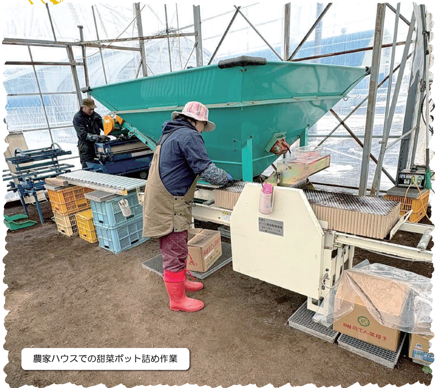
農家ハウスでの甜菜ポット詰め作業