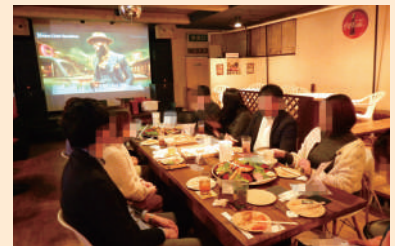
趣味の話題で意気投合

来月も新しい企画を準備中です！少しでも気になったら、ぜひお気軽にJ Aびほろ営農振興課までお声掛けください。