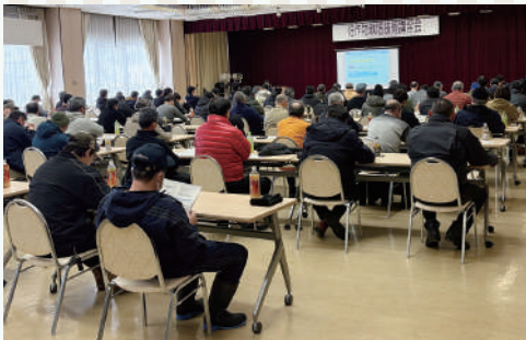
141名の生産者が参加され、皆さん熱心に聞き入っていました