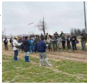
講習会には110名の生産者にご参加いただきました

本年は雪解けが早く農作業が本格化する中、多くの生産者の皆様にお集まりいただきました。