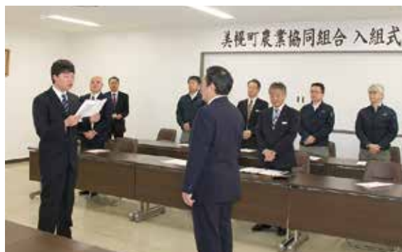
誓いの言葉とともに、農協職員として頑張ります！

3月23日、令和8年度新入職員入組式が行われました。 新たに3名の職員が入組しました。皆様どうぞよろしく お願いいたします！