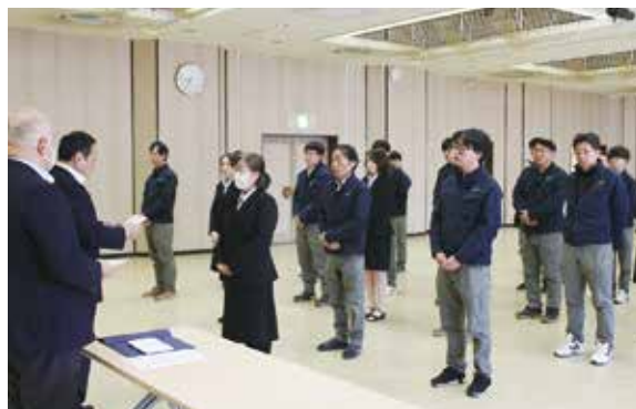
組合長から辞令が交付されました