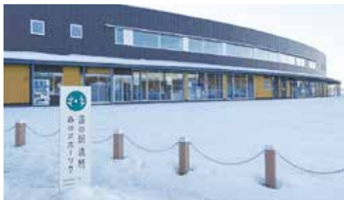
〈モダンな外観デザインの道の駅遠軽〉