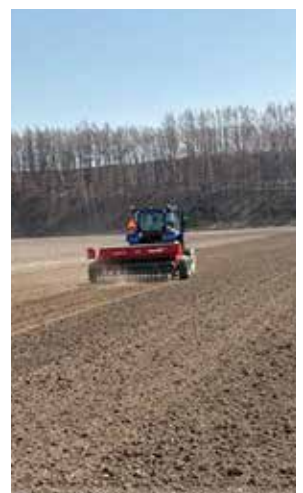
春まき小麦播種作業の様子

土の状態を見極めながら丁寧に播種作業が行われています。元気な芽が顔を出す日を待ちながら、今後も丁寧に管理していきます。