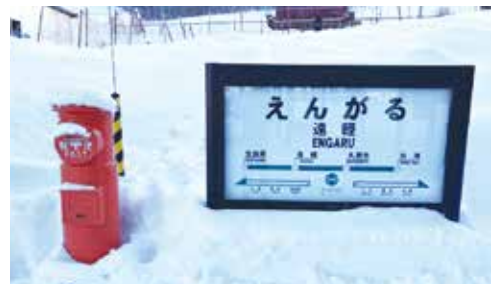
〈旭川紋別自動車道直結〉