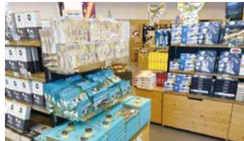
〈特産品が並ぶ売店コーナー〉

旭川紋別自動車道に直結しており、アクセスの良さも魅力の一つです。近くにお寄りの際は是非ドライブのおともに「びほろサッシーじゃがスティック」を手にとってみてください。